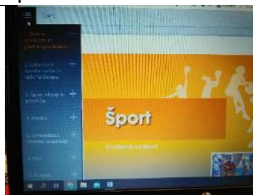
Npr.: pod 12. točko je Košarka