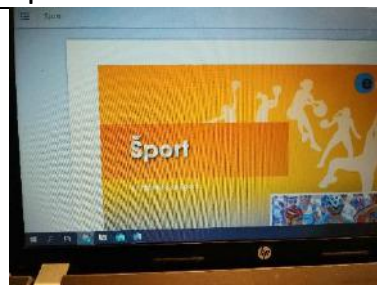
E-učbenik (meni je levo zgoraj)