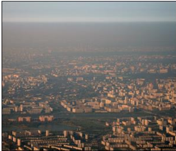
Hitra rast prebivalstva

Najpomembnejši dejavniki, ki vplivajo na življenjsko pestrost so: tektonske razmere, kamninske razmere, relief, podnebje, pedološke razmere, biološki dejavniki, hitra rast prebivalstva, onesnaževanje okolja, vnašanje tujerodnih vrst, turizem in rekreacija, nevednost, lagodnost.