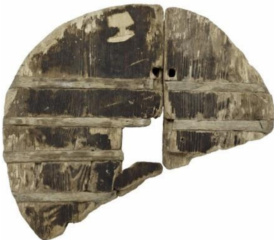
Najstarejše kolo najdeno na Ljubljanskem barju

V letošnjem šolskem letu smo za 30. festival Turizmu pomaga lastna glava z izhodiščno temo Zeleni turizem imeli veliko idej. Na koncu smo prišli do zaključka, da mora naš projekt biti nekaj zanimivega, nekaj aktivnega in nekaj posebnega. Odločili smo se za naravno okolje v okolici Ljubljane. Tako smo povezali zgodovino in sodobnost. Spraševali smo se po potrebah sodobnega »razvajenega« popotnika. Tako je nastal Deblakov pristan, luksuzni raj v malem, kjer lahko uživamo v koliščarskih hišah v zeleni oazi na robu Ljubljane.